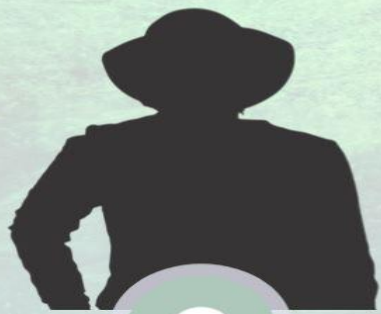
CECYLIA- PROTOPLASTKA RODU BOHATYROWICZÓW