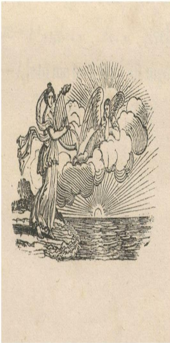
Ilustracja do drugiego wydania dramatu, 1837 r.