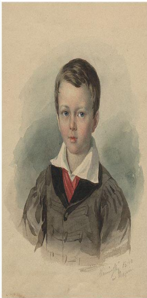
Ksawery Jan Kaniewski, Portret chłopca, 1840 r.