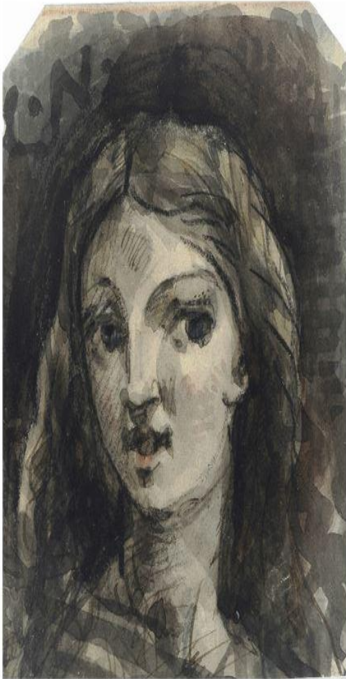
Cyprian Norwid, Głowa kobiety, 1863 r.