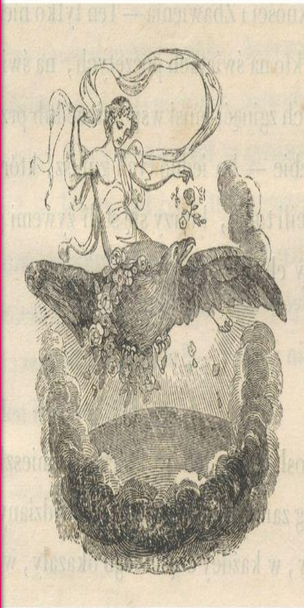
Ilustracja do drugiego wydania dramatu, 1837 r.