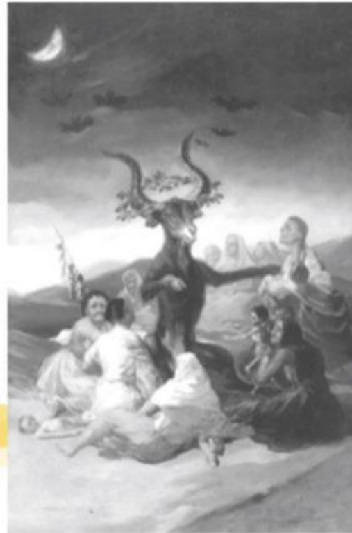
FRANCISCO GOYA: EL MACHO CABRIO