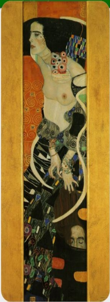
Gustav Klimt Salome , 1909