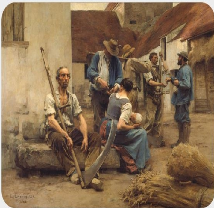
Leon Lhermitte Zapłata żniwiarzy , 1882

obrazowanie ciemnych stron życia, ludzkiej biedy, marginesu społecznego