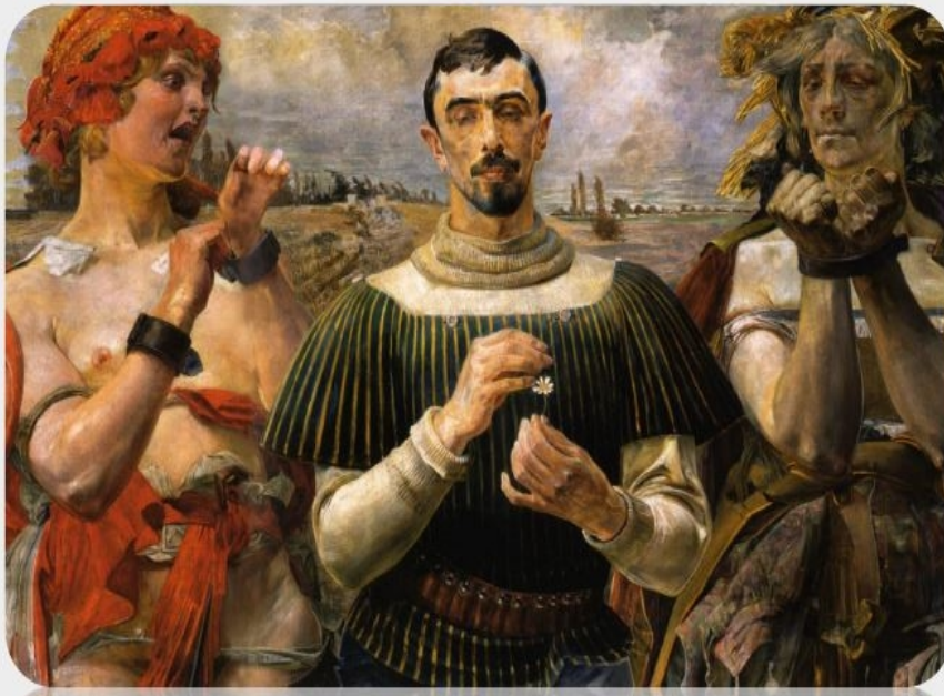
Jacek Malczewski Hamlet polski , 1903