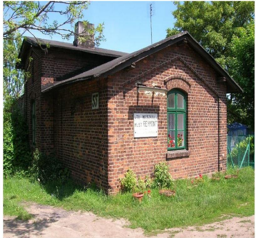
Dom Władysława Reymonta w Lipcach

Jacek Malczewski, Władysław Reymont, 1905, olej na płótnie, Muzeum Narodowe w Warszawie, domena publiczna