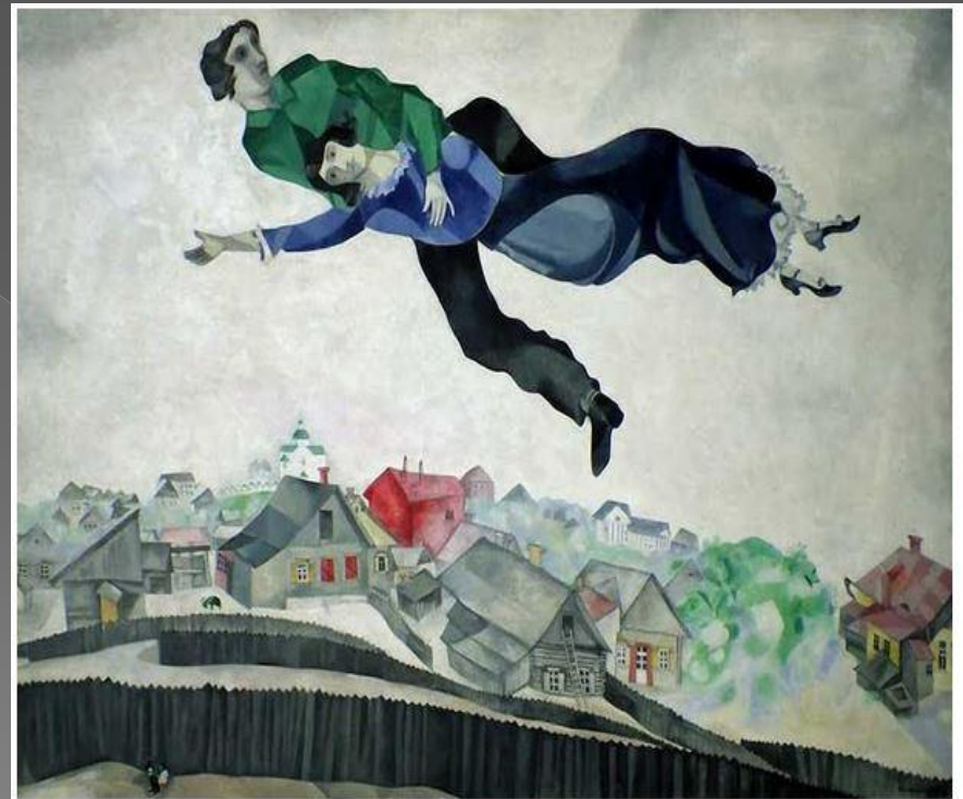
Marc Chagall, „zakochani nad miastem” , 1915