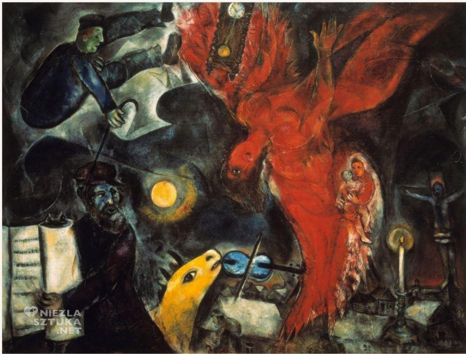
Marc Chagall Upadły Anioł | 1923-47, kolekcja prywatna