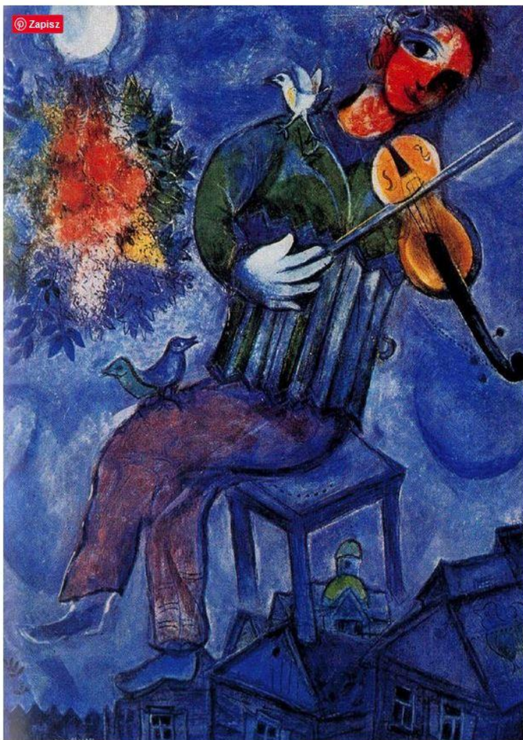
Marc Chagall, "Błękitny skrzypek", 1974