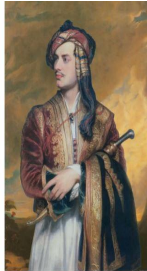
Thomas Phillips, Byron w stroju albańskim , 1835