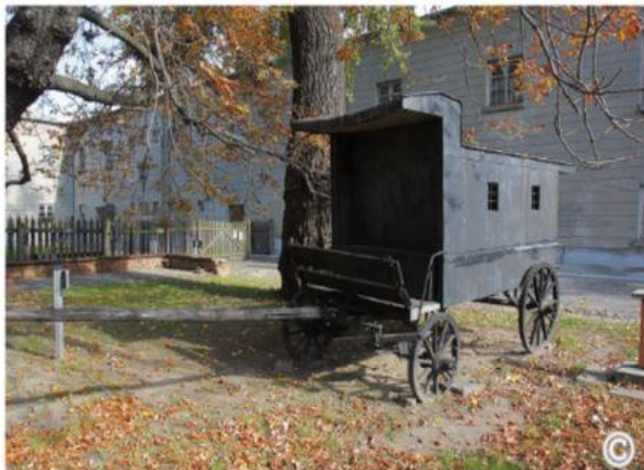
Kibitka, eksponat z Cytadeli Warszawskiej

[...] został z jedenastu Pielgrzym, sam jeden, zaśmiał się złośliwie, Wzniósł rękę, ścisnął i uderzył mściwie W głaz, jakby groził temu głazów miastu. Potem na piersiach założył ramiona I stał dumając, i w cesarskim dworze Utkwił źrenice dwie jako dwa noże; I był podobny wtenczas do Samsona, Gdy zdradą wzięty i skuty więzami Pod Filistynów dumiał kolumnami.