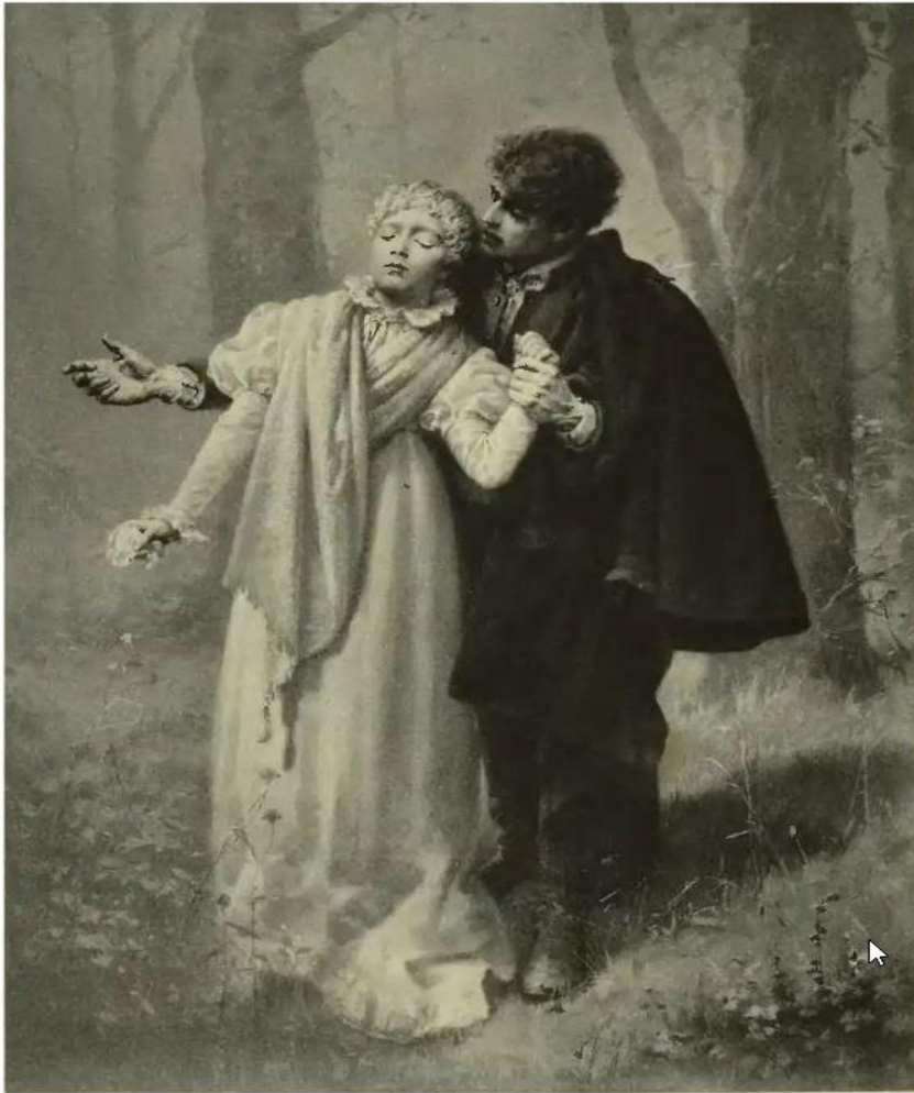
Charles-Boris de Jankowski, ilustracja do Dziadów , 1896