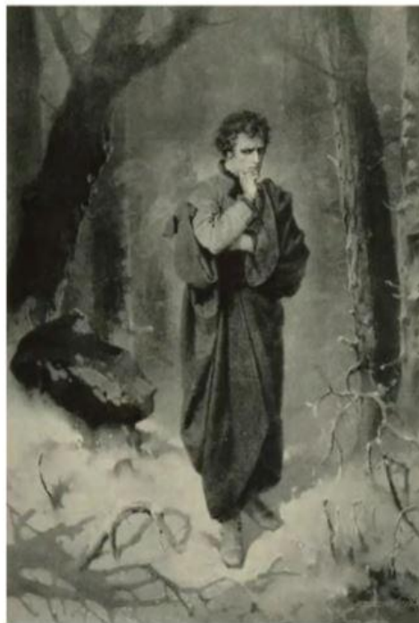
Charles-Boris de Jankowski, ilustracja do Dziadów , 1896

Bo słuchajcie i zważcie u siebie, Że według bożego rozkazu: Kto za życia choć raz był w niebie, Ten po śmierci nie trafi od razu.