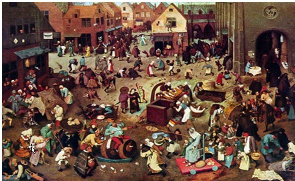
Pieter Bruegel, Walka karnawału z postem

Odprawiano wówczas parodie mszy świętej. Kaznodzieja naśladował odgłosy zwierząt i wznosił toasty podczas „kazania”. Najmłodszy kleryk przebierał się za papieża, mieszczanie za szlachtę, mężczyźni za kobiety itp. Przez miasta przechodziły orszaki, których uczestnicy siedzieli na osiołkach twarzami do ogonów. Kończyły się one na cmentarzach, gdzie obficie ucztowano.