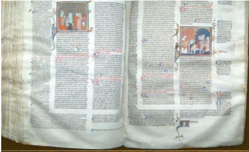
Biblia Królowej Zofii