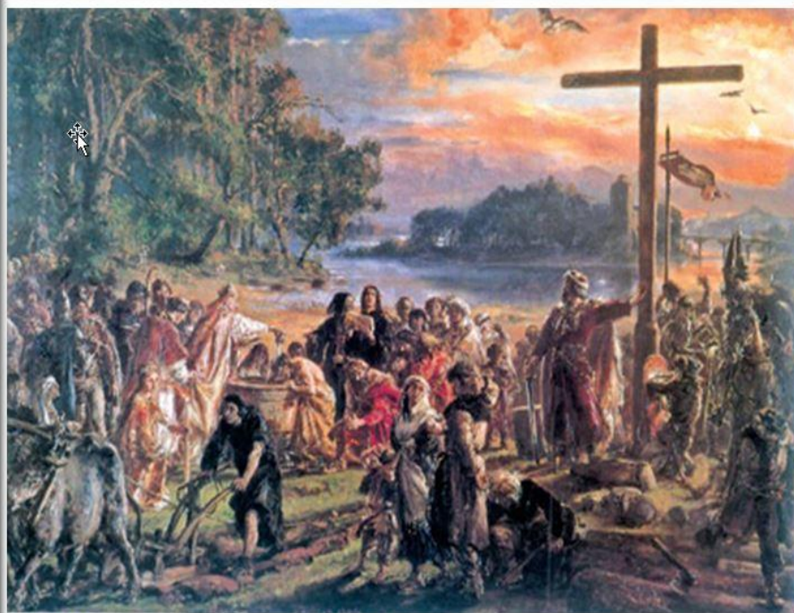
Jan Matejko, Zaprowadzenie chrześcijaństwa

Polska związała się z chrześcijaństwem łacińskim, w przeciwieństwie do większości ludów słowiańskich, uznających zwierzchność patriarchy Konstantynopola.