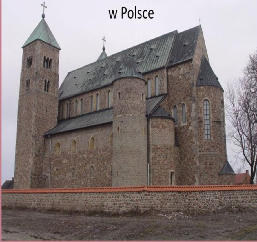
Architektura romańska w Polsce