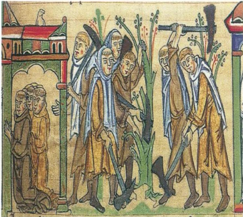
Cystersi – modlitwa i praca w polu, miniatura średniowieczna