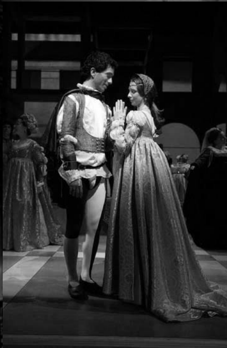
Sztuka „Romeo i Julia”