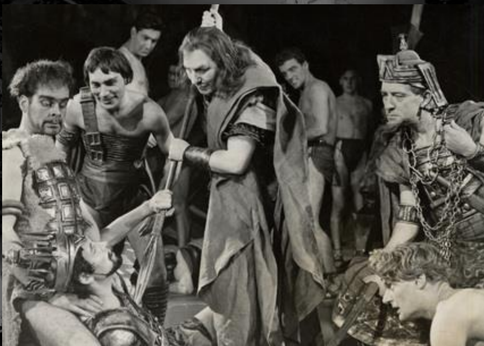
Sztuka „Tamerlan Wielki”