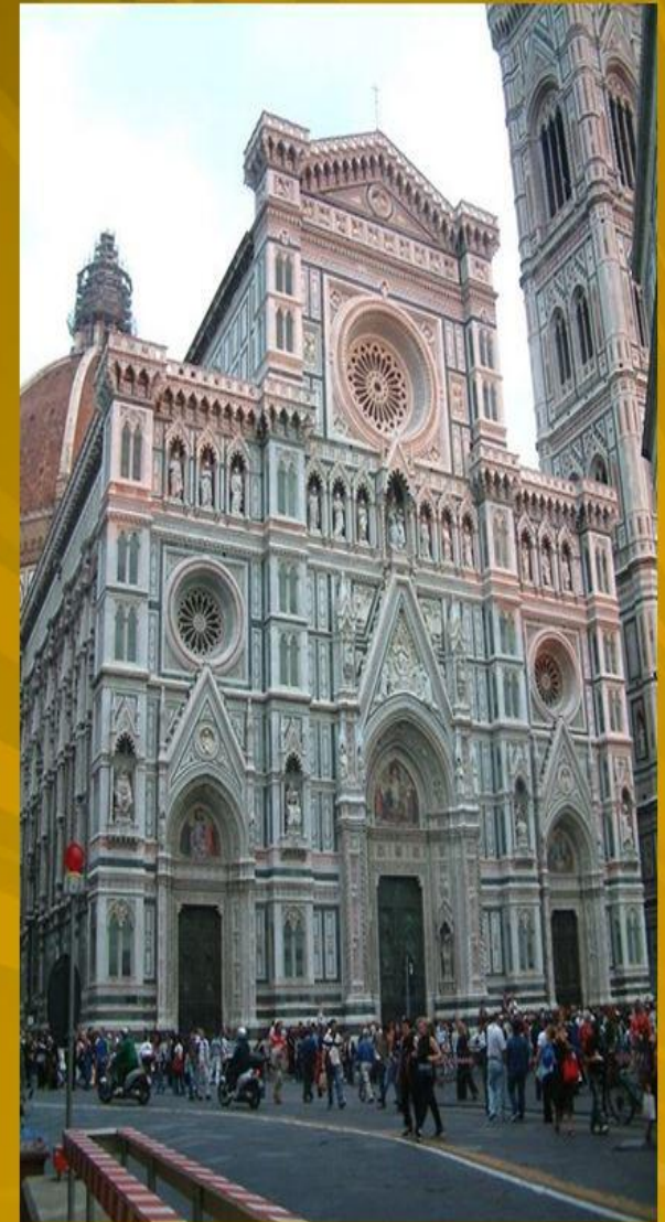
Katedra we Florencji