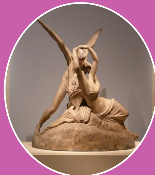
Antonio Canova, Kupidyn budzący Psyche