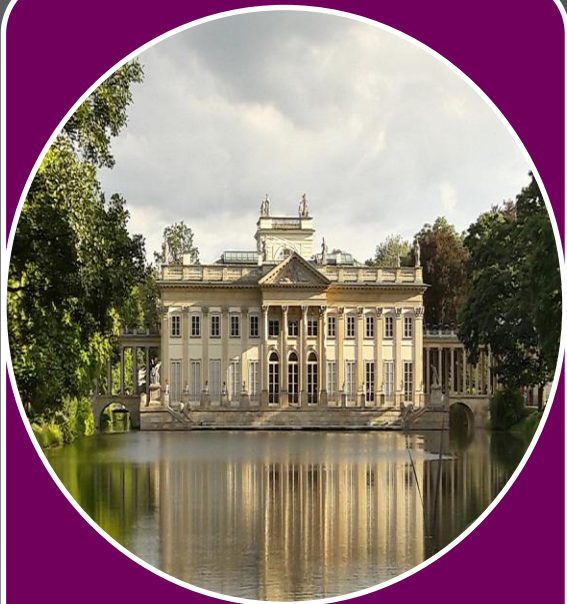
Łazienki Królewskie w Warszawie