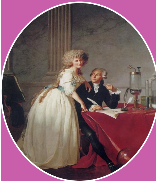
Jacques Louis David, Portret małżonków Lavoisier