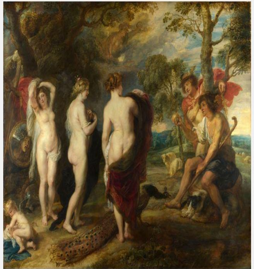
Sąd Parysa , Peter Paul Rubens, 1632-1635, National Gallery w Londynie.

Fabula Odprawy postów greckich odwołuje się do mitu trojańskiego, który Kochanowski znał przede wszystkim z Illiady Homera. Poeta koncentruje się na wydarzeniach związanych z przybyciem do Troi tytułowych greckich postów, którzy żądają oddania porwanej przez Aleksandra (Parysa) Heleny jej prawowitemu małżonkowi Menelaosowi, królowi Sparty. Poeta rozpisuje te wydarzenia, którym w eposie poświęcono tylko jedno zdanie. Dramat skupia się na relacjach postów z narad Trojańczyków - wydać czy nie wydać Helenę.