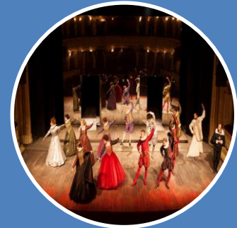
Przedstawienie teatralne itp..