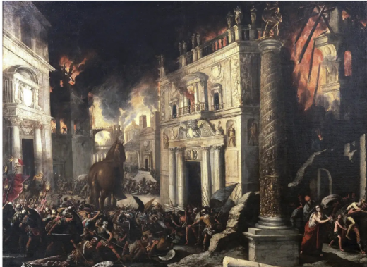
Francisco Collantes, Pożar Troi , XVII w.

Tytuł Iliada oznacza opowieść o Ilionie, czyli o Troi. Epos przedstawia jeden z epizodów wojny trojańskiej , 50 dni z ostatniego roku dziesięcioletniego oblegania Troi przez Greków (Achajów).