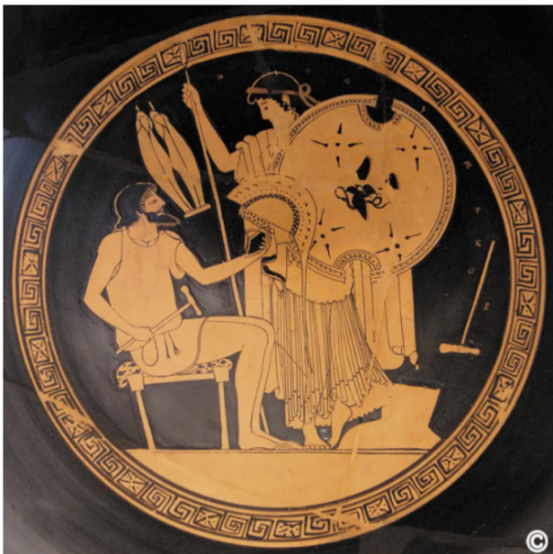
Hefajstos daje Tetydzie nową zbroję dla Achillesa, malowidło czerwonofigurowe na naczyniu, V w. p.n.e.

Retardacja (łac. retardatio 'opóźnienie') – figura retoryczna, mająca na celu zwiększenie napięcia u czytelnika poprzez opóźnienie bądź zatrzymanie akcji utworu. Przykładem retardacji w Iliadzie jest przeniesienie akcji tuż przed istotnym pojedynkiem Hektora i Achillesa do kuźni Hefajstosa, który na prośbę Tetydy wykuwał zbroję dla Hektora.