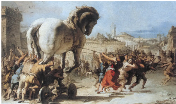
Giovanni Domenico Tiepolo, Wprowadzenie konia trojańskiego do Troi , 1760

Tytuł Iliada oznacza opowieść o Ilionie, czyli o Troi. Epos przedstawia jeden z epizodów wojny trojańskiej , 50 dni z ostatniego roku dziesięcioletniego oblężenia Troi przez Greków (Achajów).