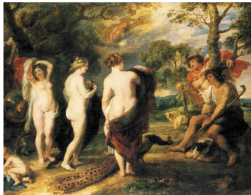
Paul Peter Rubens, Sąd Parysa , 1632-1635

Tytuł Iliada oznacza opowieść o Ilionie, czyli o Troi. Epos przedstawia jeden z epizodów wojny trojańskiej , 50 dni z ostatniego roku dziesięcioletniego oblegania Troi przez Greków (Achajów).